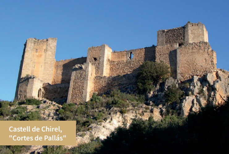
Castell de Chirel, "Cortes de Pallás"

ginebres, coscolla i arboços, amb altures que superen els mil metres d'altitud: el Puntal del Conejo (1.066 m), Montemayor (1.105 m), el Caroig (1.128 m) i el pic Palomera, que amb els 1.260 m és el cim principal de la comarca.