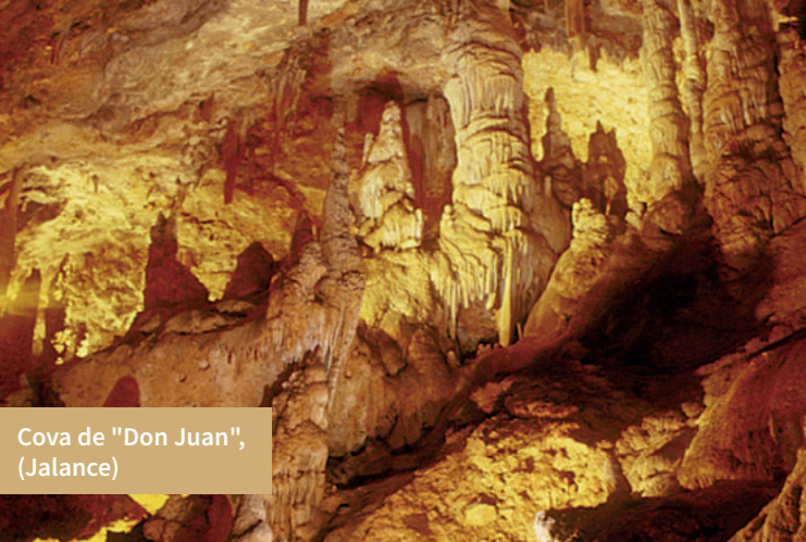
Cova de "Don Juan", (Jalance)

Turisme de Las Jaras i el Coto Social de Palomeras. Tot això sense oblidar les aportacions al món actual de les modernes tecnologies, com la central nuclear de Cofrentes i el gran complex hidroelèctric de Cortes - La Muela, amb una impressionant central subterrània. Entre Cofrentes i la presa de Cortes hi ha un tram navegable de quasi 14 km de recorregut, que travessa paisatges de gran bellesa. Funciona una ruta fluvial a través d'una naturalesa privilegiada al costat de la Reserva Nacional de la Muela de Cortes que ofereix al viatger paisatges espectaculars i solitaris durant tot l'any.