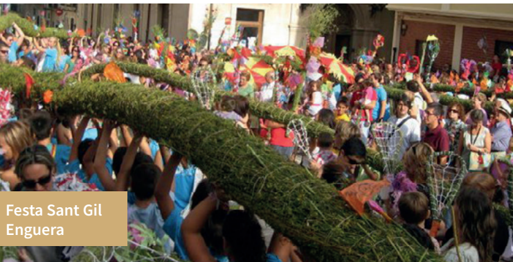
Festa Sant Gil Enguera

Enguera, al setembre, amb l'acolorida celebració de Sant Gil, i Navarrés, a l'octubre. Tot un ventall de festes en les quals s'entremesclen les celebracions religioses, paganes i gastronòmiques.