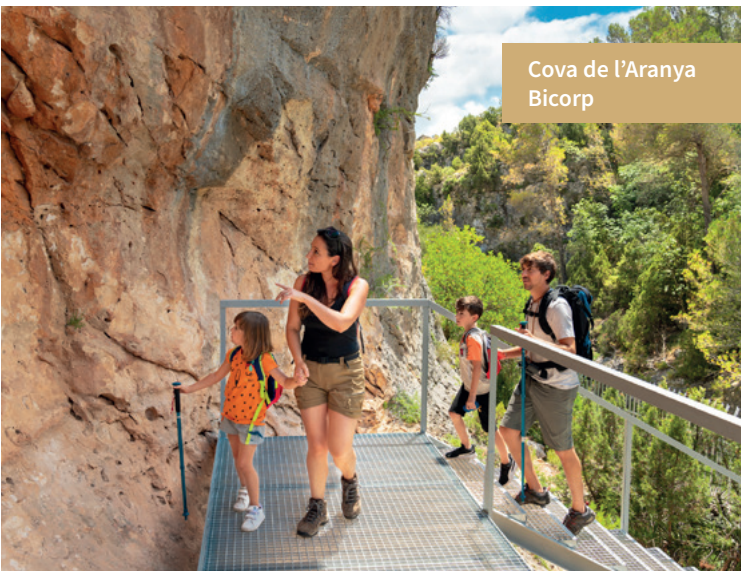
Cova de l'Aranya Bicorp

Seguint la carretera cap a l'interior convé visitar els carrers estrets i pintorescos de tots i cada un dels seus pobles, i visitar enclavaments naturals com: la Playa Salvaje o El Salto a Chella, el paratge Los Chorradores o el llac de Playamonte a Navarrés, el naixement dels rius Fraile i Cazuma a Bicorp, sempre amb la imponent silueta del pic Caroig de fons, des d'on s'accedeix amb més facilitat per pistes forestals. Los Charcos de Quesa és el paratge més conegut d'aquest bonic