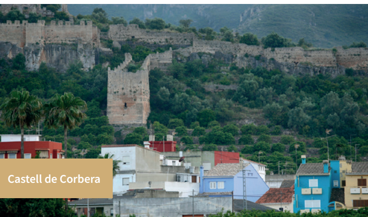
Castell de Corbera

Al Perelló, el 16 de juliol, la Mare de Déu del Carme; per Pasqua, la Mare de Déu del Roser al Mareny de Barraquetes.