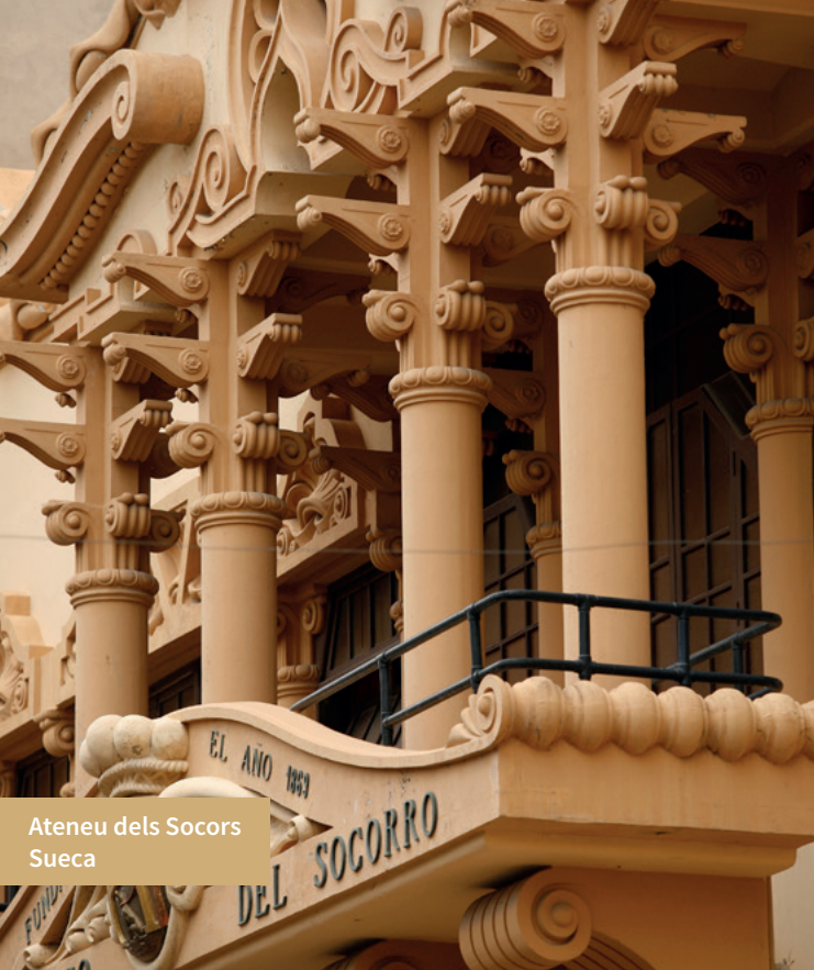
Ateneu dels Socors Sueca

Benicull de Xúquer: del 18 al 22 d'agost, festes en honor a la beata Agnès. A principi de juliol, Filles de Maria.