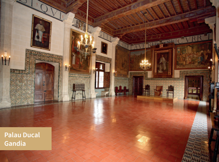
Palau Ducal Gandia

la de la vall de Vernissa (Llocnou de Sant Jeroni, Castellonet de la Conquesta, Almiserà, Ròtova, Palma de Gandia i Alfauir), així com la ruta Entre Senill i Borró, en la marjal de Gandia, o el Traçat de l'Antic Ferrocarril d'Alcoi, entre Vilallonga i l'Orxa, poden ser d'interés per al visitant amant de la naturalesa.