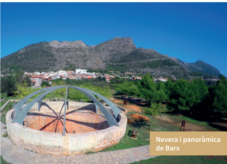
Nevera i panoràmica de Barx

Des del centre històric ens desplaçem al litoral, on l'encant de les platges, extenses i belles, guardonades amb el distintiu de la Bandera Blava i nombrosos certificats de qualitat, acompanyat per un clima benigne, permet gaudir-ne durant tot l'any. A pocs quilòmetres es troba Oliva, que ha sabut conservar el seu barri antic amb el traçat urbanístic original de la florent època medieval. Es pot passejar per l'antiga Vila Cristiana entre les seues esglésies, cases senyorials, antics portals i museus. Podem pujar a l'antic barri morisc del Raval, que conserva els típics carrers costeruts i estrets bastits sobre la pedra. Impregnat d'història pel pas de multitud de pobles i cultures, acaba sempre sorprenent i captivant l'afortunat visitant que