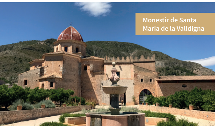
Monestir de Santa Maria de la Valldigna

En l'àmbit mediambiental destaquen, igualment, les rutes ecoturístiques de la Valldigna (Barx, Tavernes, Simat i Benifairó) o