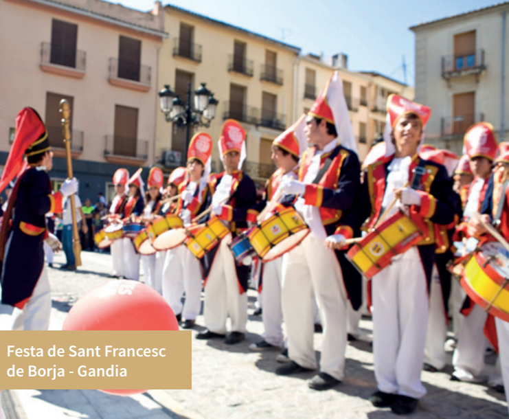
Festa de Sant Francesc de Borja - Gandia

Actualment s'estan recuperant aquestes festes que compten amb una oferta ludicocultural paral·lela molt interessant. Els porrats que se celebren actualment són, a l'hivern, Sant Antoni (gener) a Oliva i Benirredrà; al febrer, Sant Blai a Potries i Sant Macià a Ròtova; a l'estiu, Sant Llorenç i el Crist de la Sang a Tavernes de la Valldigna, Santa Anna a Simat de la Valldigna i els Sants de la Pedra a l'Alqueria de la Comtessa.