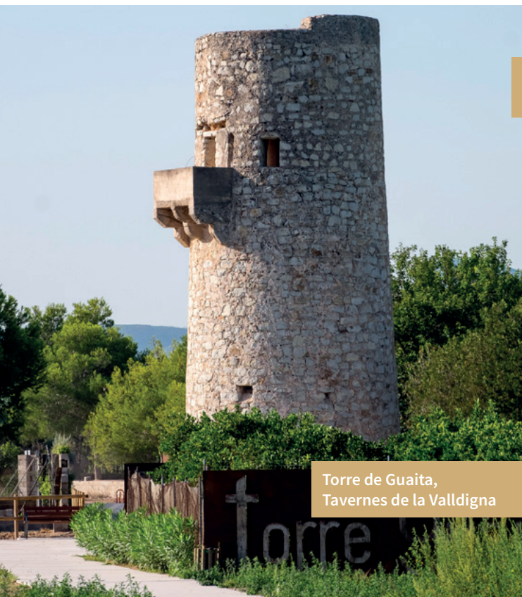
Torre de Guaita, Tavernes de la Vall d'ign

Els porrats són romeries que tradicionalment celebren els habitants de la Safor per a venerar algun sant i que es convertien en festes comarcals amb mercats de fruita seca, joguets, etc.